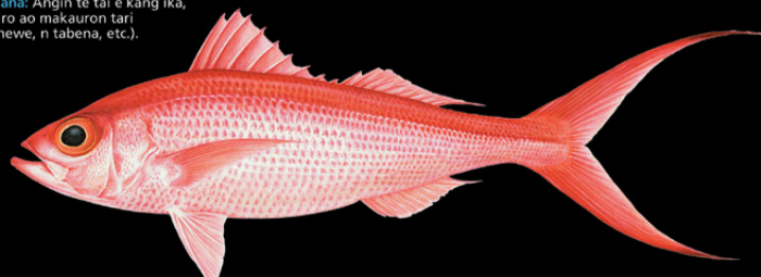
Etelis coruscans Buki-uaki • Long-tailed red snapper

Ana tabo: N te karuo ao iaon maungan antari n te nano ae 90-450 m ni kaan ma tabo aika kiriatibu. E taboreke riki n te nano ae 300 m. Tokin abakina: 120 cm Kanana: Angin te tai e kang ika, te riro ao makauron tari (te newe, n tabena, etc.).