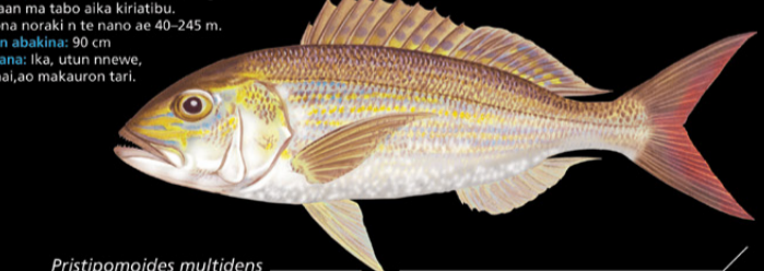
Pristipomoides multidentis Buki-mouta • Purple-cheeked jobfish

Ana tabo: N te karuo ao iaon maungan antari, ni kaan ma tabo aika kiriatibu. E kona noraki n te nano ae 40-245 m. Tokin abakina: 90 cm Kanana: Ika, utun nnewe, manai, ao makauron tari.