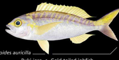
Pristipomoides auricilla Buki-iaro • Gold-tailed jobfish

Ana tabo: N te karuo ao iaon maungan antari n te nano ae 90-450 m, ni kaan ma tabo aika kiriatibu. E taboreke riki n te nano ae 300 m. Tokin abakina: 70 cm Kanana: Angin te tai e kang ika, te riro ao makauron tari (te newe, n tabena, etc.).