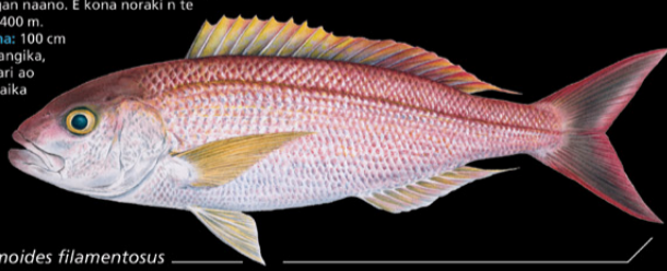
Pristipomoides filamentosus Buki-touki • Rosy jobfish

Ana tabo: Tinanikun te maran ao karabena rikaaki ao ai maungan naano. E kona noraki n te nano ae 40-400 m. Tokin abakina: 100 cm Kanana: E kangika, makauron tari ao maanin tari aika uareke.