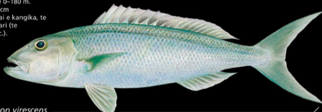
Aprion virescens Awai • Green jobfish

Ana tabo: N tabo aika rakai. E kona noraki n te nano ae 0-180 m. Tokin abakina: 112 cm Kanana: Angin te tai e kangika, te riro ao makauron tari (te newe, n tabena, etc.).