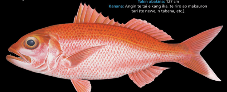
Etelis carbunculus Aratabaa • Short-tailed red snapper