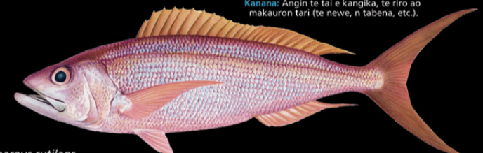
Aphaeus rutilans Bukinrin • Small-tooth jobfish

Ana tabo: Marawa ao irarikin rakai. E kona noraki n te nano ae 1-120 m. Tokin abakina: 70 cm Kanana: Te ika ao utun nnewe ao manai.