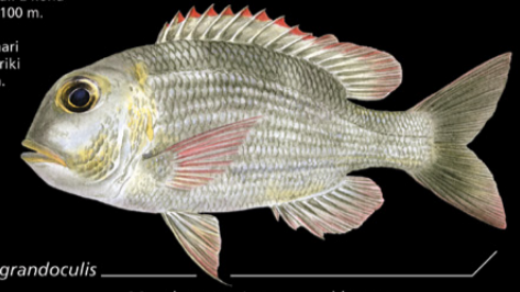
Monotaxis grandoculis Matakore • Large-eyed bream

Ana tabo: Taabo aika tanotano ao ni kiriatibu irarikin rakai. E kona noraki n te nano ae 1-100 m. Tokin abakina: 60 cm Kanana: Utun marin taari aika akea riia ao inaia, riki ake a raraumea kanaia.