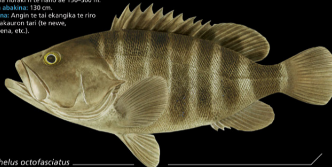
Epinephelus octofasciatus Kauoto • Eight-bar grouper

Ana tabo: Tabo aika kiriatibu ao a rakai. E kona noraki n te nano ae 150-300 m. Tokin abakina: 130 cm Kanana: Angin te tai e kangika te riro ao makauron tari (te newe, n tabena, etc.).