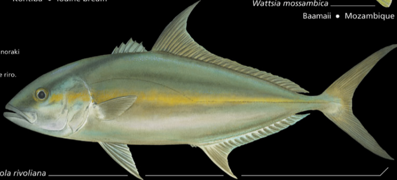
Seriola rivoliana Tieriora • Amberjack

Ana tabo: Marawa. E kona noraki n te nano ae 100-800 m. Tokin abakina: 200 cm Kanana: Ika, te baitari ao te riro.