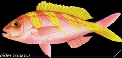
Pristipomoides zonatus Ikabaun • Banded flower snapper

Ana tabo: Tinanikun te maran ao karabena rikaaki ao ai maungan naano. E rereke n te nano ae 70-300 m. Tokin abakina: 50 cm Kanana: Angin te tai e kangika, te riro ao makauron tari (te newe, n tabena, etc.).