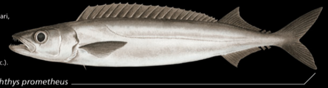
Promethichthys prometheus Tauri • Snake mackerel

Ana tabo: N te karuo ao iaon maungan antari, e mamananga nakon tabo aika nano riki n te tairiki. E kona noraki n te nano ae 100-750 m. Tokin abakina: 100 cm Kanana: Angin te tai e kangika, te rirooamakauron tari (te newe, n tabena, etc.).