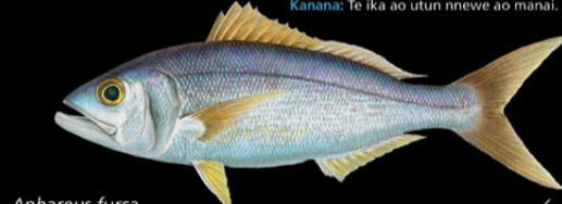
Aphaeus furca Ikakoa • Grey jobfish

Ana tabo: Marawa ao irarikin rakai. E kona noraki n te nano ae 1-120 m. Tokin abakina: 70 cm Kanana: Te ika ao utun nnewe ao manai.