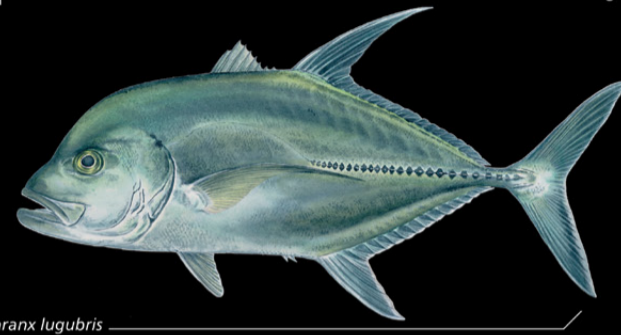
Caranx lugubris Aonga • Black trevally

Ana tabo: Tinanikun te maran ao karabena rikaaki ao ai maungan naano. E kona noraki n te nano ae 10-350 m. Tokin abakina: 100 cm Kanana: E kana te ika ao angin te tai e amamarake n te bong.