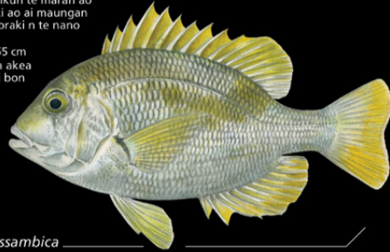
Wattsia mossambica Baamii • Mozambique large-eyed bream

Ana tabo: Tinanikun te maran ao karabena rikaaki ao ai maungan naano. E kona noraki n te nano ae 100-180 m. Tokin abakina: 55 cm Kanana: Ika aika akea riin nukata ao ai bon ikan nano.