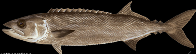
Ruvettus pretiosus Ikanenea • Oilfish

Ana tabo: Tinanikun te maran ao karabena rikaaki ao ai maungan naano. E kona noraki n te nano ae 4-300 m. Tokin abakina: 75 cm Kanana: Ika ao utun nnewe ao manai.