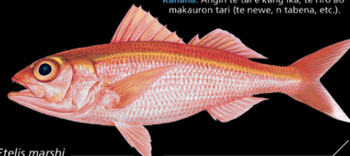
Etelis marshi Buki-mai • Marshi snapper