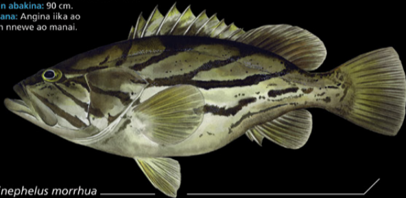
Epinephelus morrhuia Kuuu-morua • Curve banded grouper

Ana tabo: Tinanikun te maran ao karabena rikaaki ao ai maungan naano. E kona noraki n te nano ae 80-370 m. Tokin abakina: 90 cm Kanana: Angina iika ao utun nnewe ao manai.