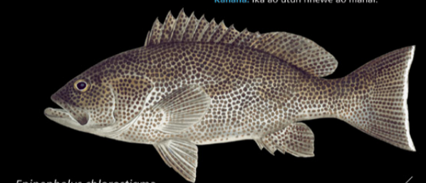
Epinephelus chlorostigma Utin-naano • Brown-spotted grouper

Ana tabo: Tinanikun te maran ao karabena rikaaki ao ai maungan naano. E kona noraki n te nano ae 4-300 m. Tokin abakina: 75 cm Kanana: Ika ao utun nnewe ao manai.