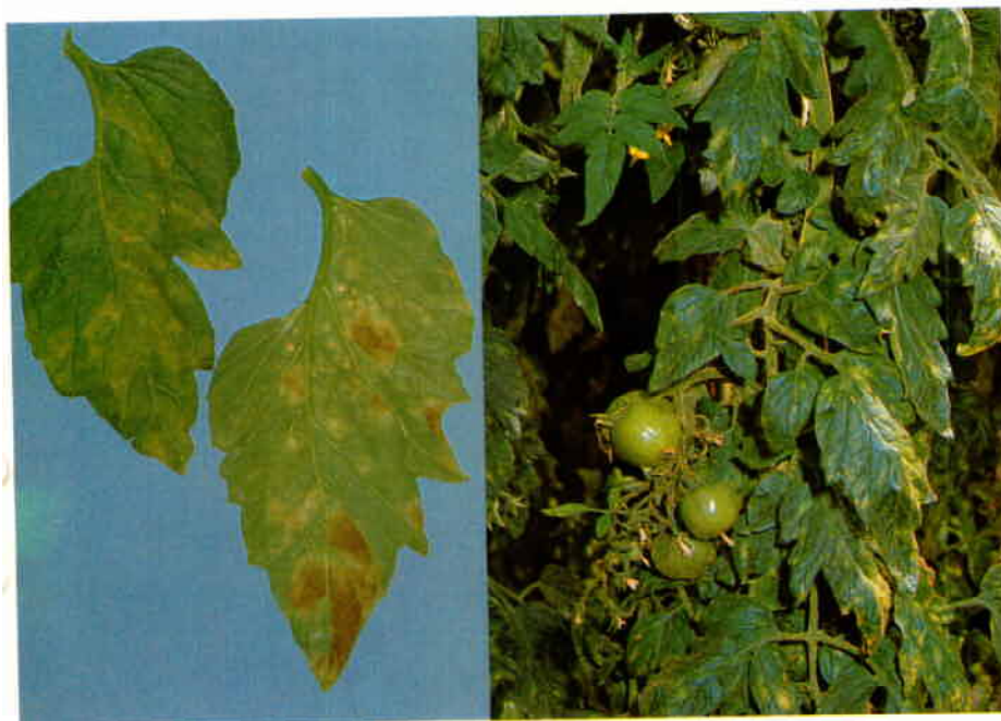
Symptômes de maladie fauve de la tomate causée par le champignon Fulvia fulva.