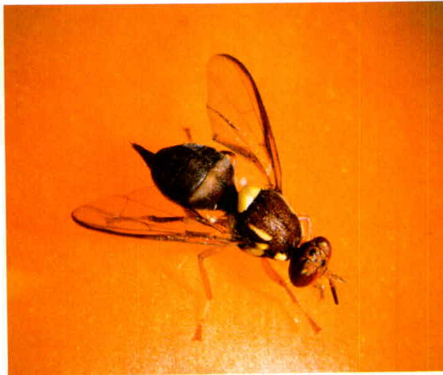
Femelle adulte (grossissement x 10)