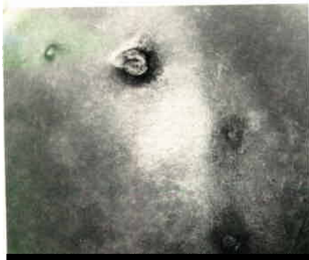
Fig. 5 : Tomate endommagée par les pontes de Dacus tryoni (grossissement x 1/4).

Le trou de ponte peut être le siège d'une infestation cryptogamique et bactérienne qui provoque une décomposition rapide du fruit. Chez certains types de fruits, on voit parfois une zone brillante et translucide correspondant à une partie dont les larves ont dévoré toute la chair, ne laissant que la peau. La vie larvaire dure au moins 7 jours. Lorsqu'elles ont atteint leur complet développement, les larves sortent du fruit et s'enfoncent en terre ou sous des débris, ou encore dans des caisses de fruits, etc., où elles se transforment en pupes. L'insecte adulte émerge de la puppe au bout d'environ 2 semaines. Les adultes peuvent vivre assez longtemps et voler sur plusieurs kilomètres. La femelle ne pond qu'au bout de 2 à 3 semaines d'existence. Une femelle peut pondre plusieurs centaines d'oeufs et il faut environ 4 à 5 semaines pour produire une génération.