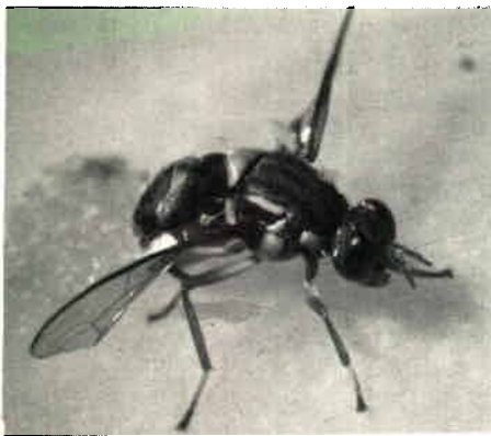
Fig. 4 : Femelle de Dacus tryoni sur le point de pondre (grossissement x 5 env.).

Pour les agrumes, utiliser du diméthoate à 0,06% (20 ml de concentré à 30% dans 10 litres d'eau) ou du fenthion à 0,06% (11