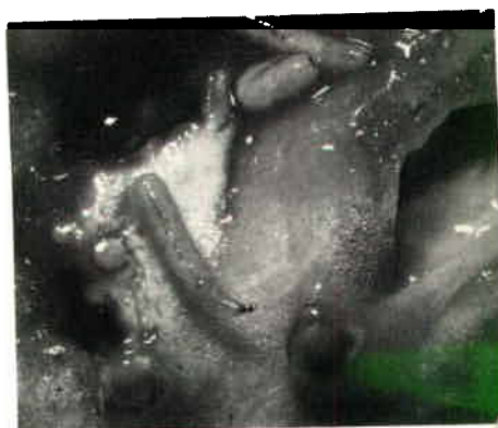
Fig. 2 : Larves de Dacus tryoni à l'intérieur d'une tomate (grossissement x 1½).

15 mm de long. Elles sont de couleur ivoire, très effilées antérieurement, tronquées à la partie postérieure (Fig. 2). A leur dernier stade, elles ont l'habitude d'arquer leur corps, puis par une détente brusque parviennent à sauter au moins 15 cm. La pupe est enfermée dans un cocon ovale brun et lisse d'environ 3 à 5 mm de long (Fig. 3).