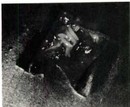
Fig. 1 : Une ponte (grossissement x 5).

Les oeufs, de couleur crème, mesurent environ 1 mm de long sur 0,2 mm de large; ils sont pondus par groupes (Fig. 1). Les larves (ou asticots) mesurent de 3 à