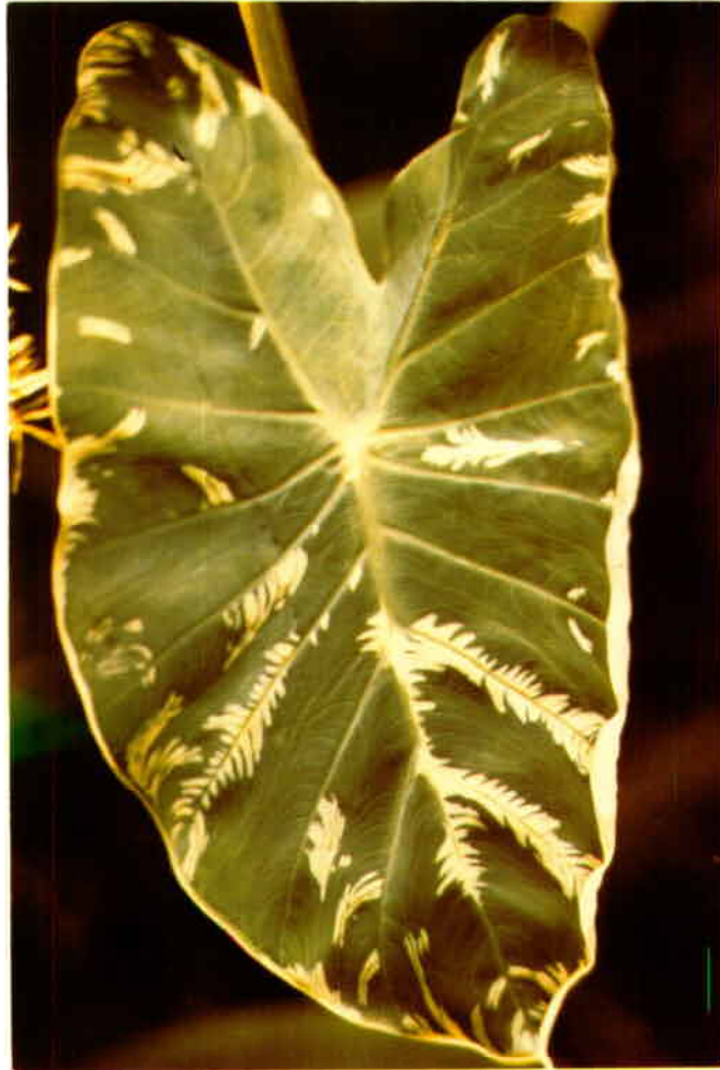
Sur cette feuille de taro, on observe les zones décolorées en forme de plumes qui sont symptomatiques du virus de la mosaïque.