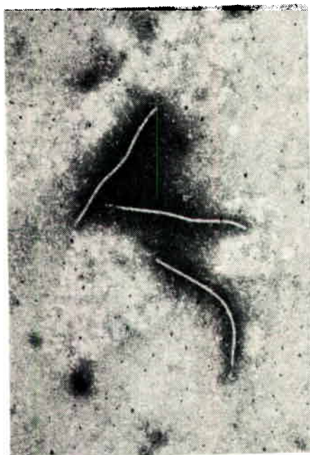
FIG. 1: Particules filamenteuses de virus de la mosaïque du taro. Chaque filament mesure environ 7.500 angströms de long (un angström = 10^{-10} mètre).

Le VMT ne provoque pas une maladie mortelle; il a pour principal effet de retarder la croissance de la plante et, par voie de conséquence, de réduire le