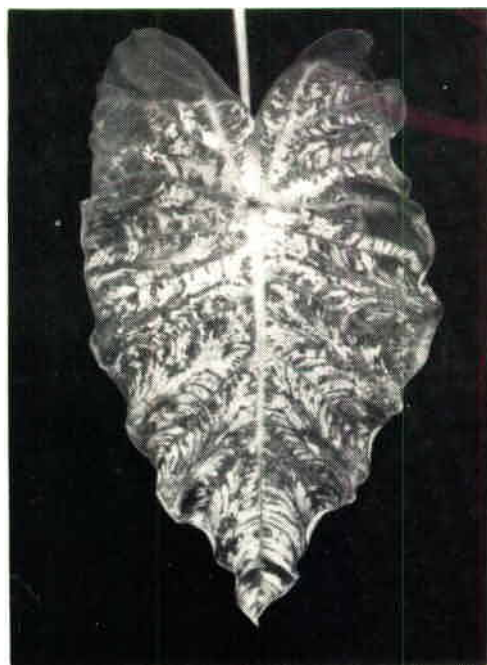
FIG. 2: Les symptômes de la mosaïque du taro ont envahi et déformé la totalité de cette feuille.

l'esprit lorsque l'on envisage les mesures de lutte étudiées ci-après.