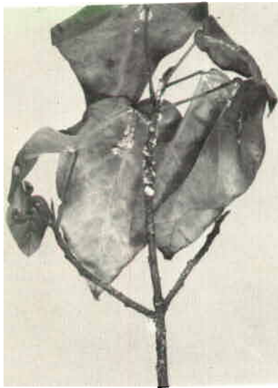
Fig. 3 : Icerya seychellarum attaquant des feuilles de rocouyer .