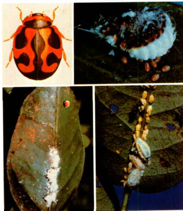
Fig. 1a (en haut à gauche). Rodolia cardinalis (taille réelle 3-4 mm).

Fig. 1b (en haut à droite). La cochenille australienne, Icerya purchasi , avec ses petites larves rampantes (taille réelle 7-9 mm).