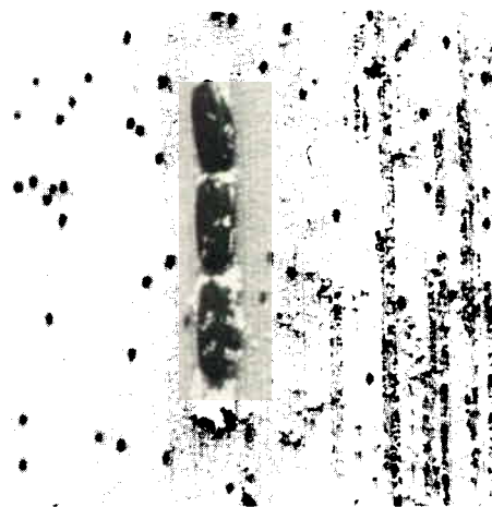
Fig. 1 : Oeufs de Brontispa (grossissement x 10).

L'adulte est un insecte long et étroit de 7 à 10 mm de long et de 2 mm de large (Fig. 4). Très plat, il a de courtes pattes et est donc parfaitement adapté à l'habitat que constituent les folioles étroitement serrées des jeunes palmes de cocotier. La couleur peut aller du jaune-rouge au noir, mais la plus courante est celle que l'on voit sur la couverture et à la page 4.