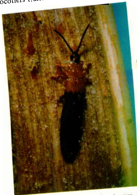
Fig. 4 : Un Brontispa adulte (noter les acariens sur la surface du corps) (grossissement x 5).

sations que sur les cocotiers sévèrement envahis. Dans les pépinières, les jeunes cocotiers sont généralement inspectés toutes les semaines ou tous les quinze jours et traités selon les besoins. On utilise un colorant pour marquer les cocotiers traités.