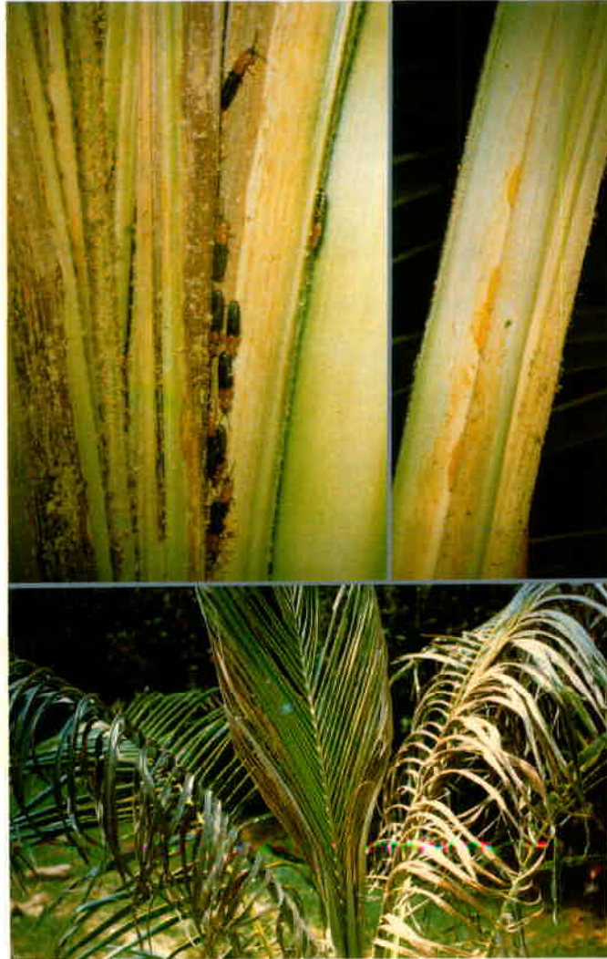
En haut à gauche : Insectes adultes sur la spathe. En haut à droite : Larves creusant la spathe. En bas : Dégâts sur jeune cocotier.