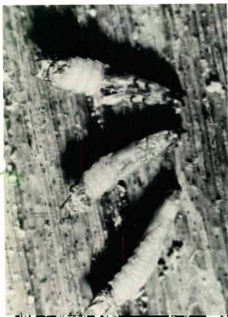
Fig. 3 : Nymphes de Brontispa (grossissement x 3).

Ce sont généralement les palmes de moins de 4 à 5 ans qui sont les plus sévèrement attaquées. Les feuilles du cocotier adulte étant plus grandes et l'attaque pouvant se faire simultanément sur plusieurs feuilles, les dégâts causés par un nombre identique de brontispes sont proportionnellement moins étendus que chez un arbre jeune. Il arrive cependant que les cocotiers adultes soient sévèrement attaqués — le phénomène semble se produire peu après l'apparition du parasite dans une zone jusque-là indemne — mais l'importance des dégâts dépend du cultivar. Des attaques répétées peuvent tuer le cocotier. D'autre part, les arbres affaiblis par les dommages que lui inflige ce ravageur sont plus vulnérables à la sécheresse et plus susceptibles aux maladies.