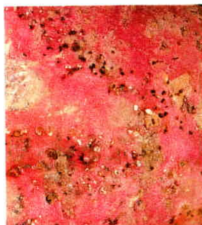
Surface d'un tubercule portant des trous effectués par des adultes pour pondre et se nourrir.