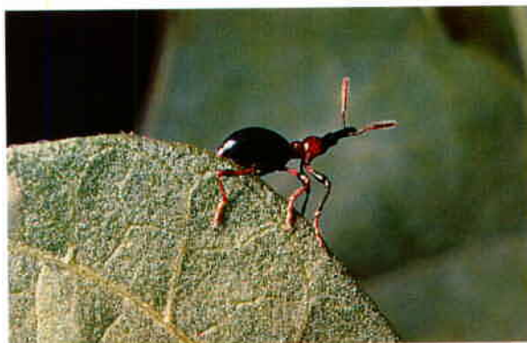
Mâle adulte de Cylas formicarius (gros 3 fois).