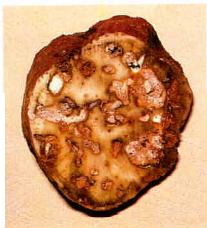
Tubercule miné par les larves (notez le charançon tout juste parvenu au stade adulte en haut de la photographie)